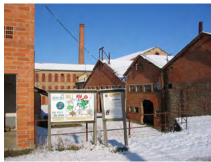
départ du sentier d'interprétation

et aussi un lieu de mémoire d'un intense activité ouvrière