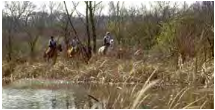
Passage de randonnées cheval ou vtt