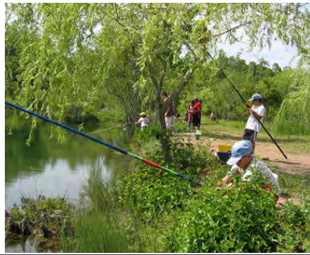
activité de pêche sur les étangs