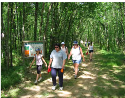
randonnée pédestre le 11 juin